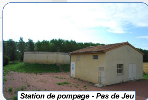
Station de pompage - Pas de Jeu

Les actions se concentrent sur trois territoires appelés « bassin d'alimentation de captage » (BAC). Ils correspondent aux nappes d'eau souterraine dans lesquelles le SEVT capte l'eau. On distingue ainsi les BAC de Pas de Jeu, Ligaine et des Lutineaux. Situés sur 9 communes des Deux-Sèvres et 3 de la Vienne, ils couvrent une superficie totale de 5 271 ha, comme le montre la carte ci-dessous.