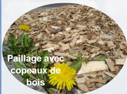
Paillage avec copeaux de bois